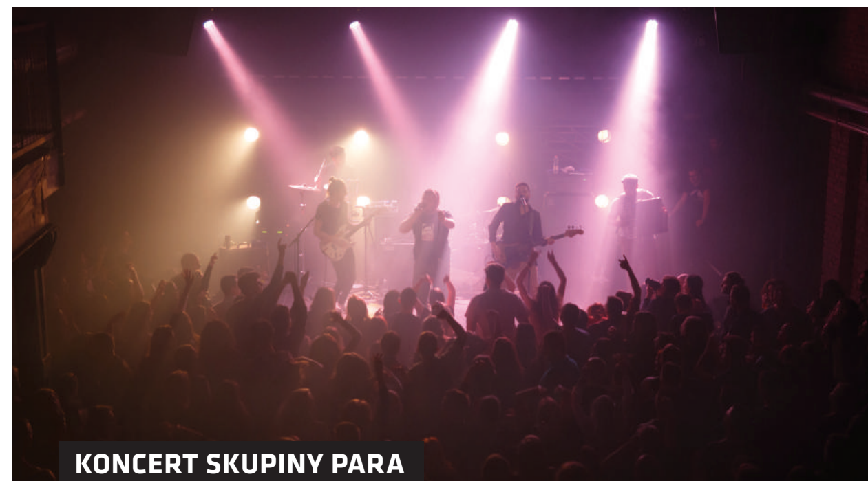
KONCERT SKUPINY PARA NA FESTIVALE PUCUNG

Finálna podoba zákona, ktorú v lete 2015 parlament schválil, mala stále výrazné nedostatky a Nadácia sa téme schránkových firiem venovala aj v rámci iniciatívy Štrngám za zmenu . Spoločná iniciatíva organizácií Nadácia Zastavme korupciu, Pontis, Via Iuris a Inštitút SGI si dala za cieľ pripraviť odborné legislatívne návrhy v oblasti justície, polície, prokuratúry, Najvyššieho kontrolného úradu, schránkových firiem a prikrmovania, a primäť politické strany pred parlamentnými voľbami k záväzku presadzovať tieto návrhy v novom funkčnom období. Nadácia sa v rámci iniciatívy venovala posledným dvom spomenutým témam, v čom jej výrazne pomohli advokáti kancelárie TaylorWessing.