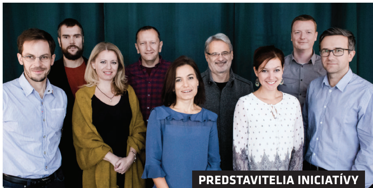
PREDSTAVITELIA INICIATÍVY ŠTRNGÁM ZA ZMENU

Keďže ale návrh stále nezodpovedal kritériám účinného protischránkového zákona, kampaňou Odzvoňme schránkam sme sa rozhodli mobilizovať verejnosť, aby vyvinula tlak na vládu, aby neschválila navrhované znenie. V rámci celoslovenskej mobilizácie naša karibská kampaňová palma obišla všetkých 8 krajských miest, kde sme širokej verejnosti poskytovali potrebné informácie a organizovali diskusie na tému korupcie.