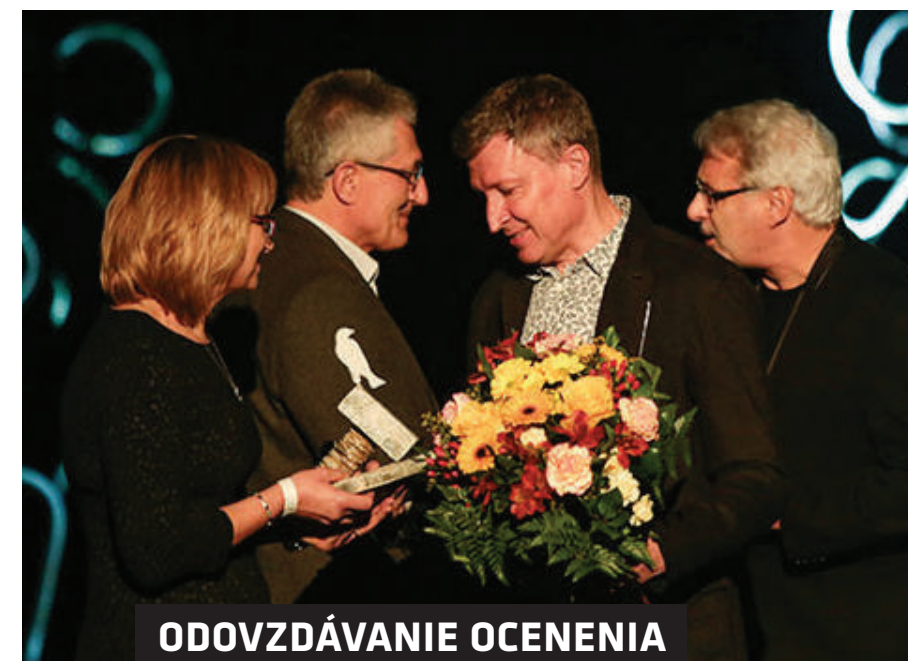
ODOVZDÁVANIE OCENENIA BIELA VRANA